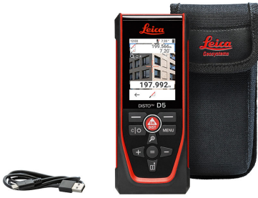
Leica DISTO™ D5 Art. Nr. 950908

Leica DISTO™ D5, Tasche, USB-C auf USB-A Kabel, Handschleufe, Kurzanleitung, Garantiekarte, Sicherheitshandbuch, Kalibrierungszertifikat Silber