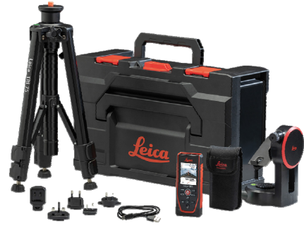
Leica DISTO™ D5-Paket Art. Nr. 950879

Leica DISTO™ D5, Tasche, USB-C auf USB-A Kabel, Handschleufe, Kurzanleitung, Garantiekarte, Sicherheitshandbuch, Kalibrierungszertifikat Silber